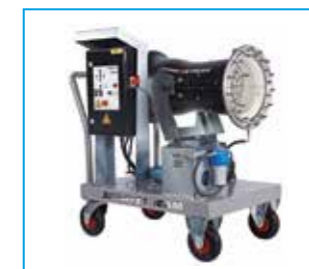
SPRAYSTREAM 25i Trolley Wurfweite 25 m