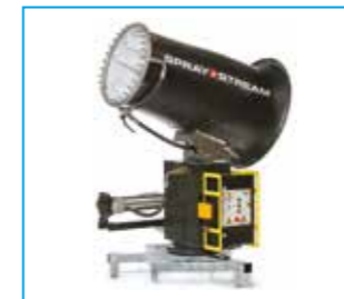
SPRAYSTREAM 50i/60i/70i Wurfweiten 50/60/70 m