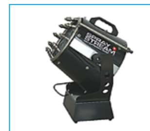
SPRAYSTREAM 10i Trolley Wurfweite 10 m