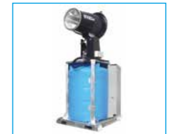
SPRAYSTREAM 50i Vertikaltank 3.000 L