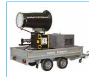
SPRAYSTREAM 50i Power Autarker Anhänger mit Generator