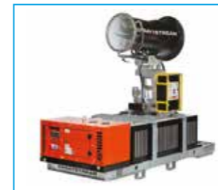
SPRAYSTREAM 35i Autarke Vernebelungsmaschine 1.250-L-Tank