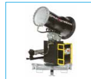
SPRAYSTREAM 35i Wurfweite 35 m