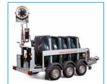
SPRAYSTREAM 25i Autarker Anhänger mit 2.000-L-Tank und Generator