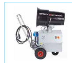
SPRAYSTREAM 15i Trolley Wurfweite 15 m