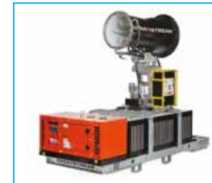
SPRAYSTREAM 35i Autarke Vernebelungsmaschine 1.250-L-Tank