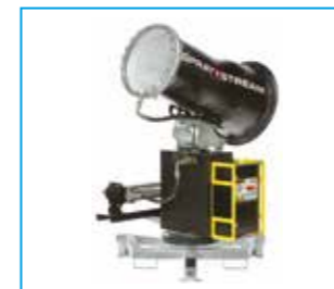
SPRAYSTREAM 35i Wurfweite 35 m