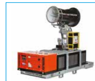
SPRAYSTREAM 35i Autarke Vernebelungsmaschine 1.250-L-Tank