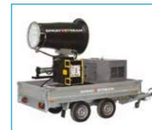
SPRAYSTREAM 50i Power Autarker Anhänger mit Generator